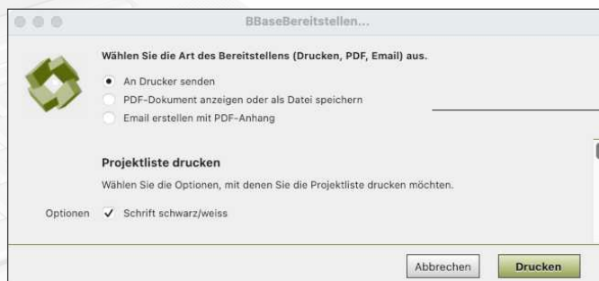
Dialog für das Bereitstellen mit den unterschiedlichen Optionen

Das Bereitstellen beinhaltet: 'Dokument drucken', 'Dokument als PDF ablegen', 'Dokument als Email erstellen'.